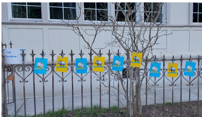
Wirkungsvolle Flyeraktion eines DLV-Mitglieds

Der Tag der Logopädie ging 2025 mit dem Titel «Damit Wortschatz nicht Glückssache ist – Logopädie lohnt sich» erfolgreich über die Bühne. Die Arbeitsgruppe gestaltete zwei bunte «Verwirrplakate» (siehe Titelbild), die auf humorvolle Art anhand von gängigen Wortverwechslungen auf die verschiedenen Störungsbilder im Bereich Wortschatz/Wortfindung und somit letztendlich auf die Logopädie im Allgemeinen aufmerksam gemacht haben. Zusätzlich wurde ein Gewinnspiel mit Fragen zur Logopädie durchgeführt. Drei glückliche Gewinner:innen durften sich als Preis entweder das Spiel «ABC SRF 3» oder das Kinderbilderbuch «Der Wortschatz» aussuchen. Den QR-Code für das Gewinnspiel fand man im Inneren der Glückskekse, die in Verteilaktionen – zusammen mit «Verwirrpostkarten» in der Deutschschweiz unter die Leute gebracht wurden. Viele schöne Bilder von Verteilaktionen sowie Fotos von Zeichnungen von Kindern, die sich gemeinsam mit ihrer Logopädin weitere «Verwirrmotive» überlegt hatten, erreichten den DLV. Auch die Kommission Social Media hat sich weitere Motive überlegt und rege gepostet. Der Radiosender SRF 3 konnte dafür gewonnen werden, am Morgen des 6. März vor dem Spiel «ABC SRF 3» den Tag der Logopädie zu erwähnen sowie die verschiedenen Facetten und die Wichtigkeit des Berufs aufzuzeigen.