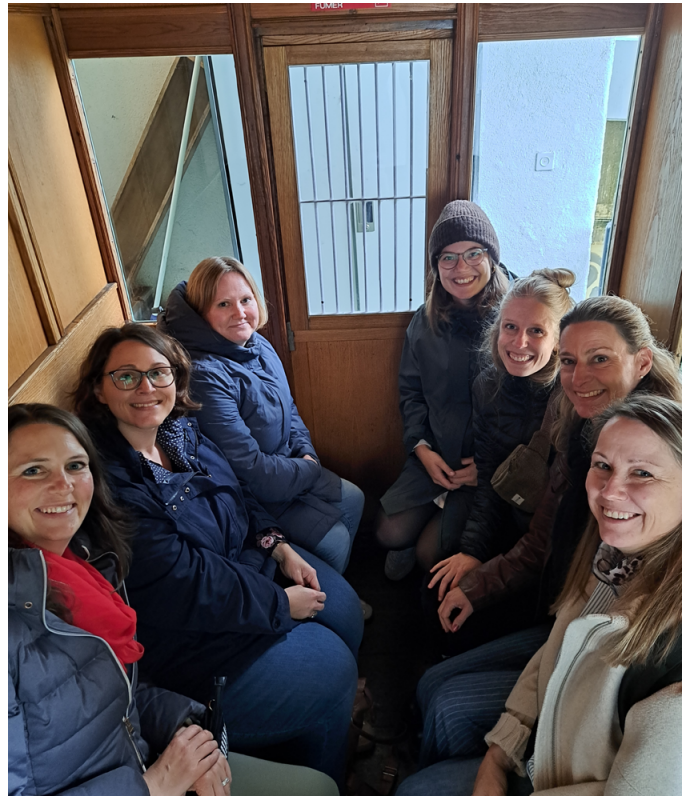
DLV-Vorstand an der Retraite in Fribourg

Der Gesamtvorstand traf sich zu sieben Halbtagesitzungen, einer Ganztagesitzung, einer Retraite von 1.5 Tagen sowie zur Delegiertenversammlung. Daneben nahm jedes Vorstandsmitglied an diversen weiteren Anlässen teil (zweimal jährlich Präsident:innen-Konferenz, Anlässe anderer Verbände, kantonale GV's etc.). Inhaltlich war jedes Vorstandsmitglied mindestens für ein Projekt verantwortlich, die mei-