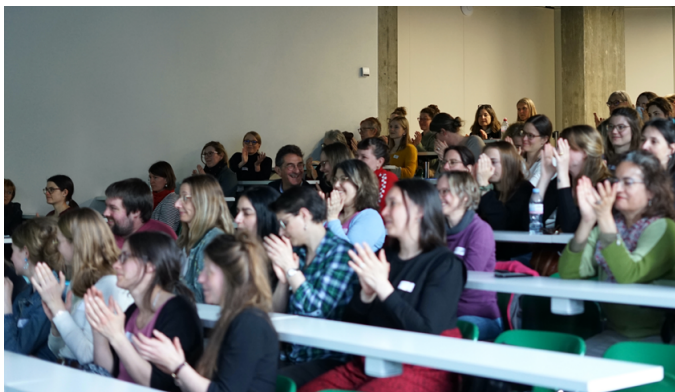
Rege Teilnahme am klinischen Vernetzungsanlass

Treffen medizinisch-therapeutisch tätiger Logopäd:innen Am 1. April 2025 trafen sich rund 90 Logopäd:innen aus dem klinischen Bereich in Olten. Inhalte waren u.a. die laufenden Tarifverhandlungen, der Stand bezüglich Qualitätsverträge und elektronischem Patientendossier sowie die Ergebnisse der DLV-Arbeitsgruppe Advanced Practice Rollen. Die Rückmeldungen zum Anlass zeigten, dass dieser Austausch sehr geschätzt wurde.