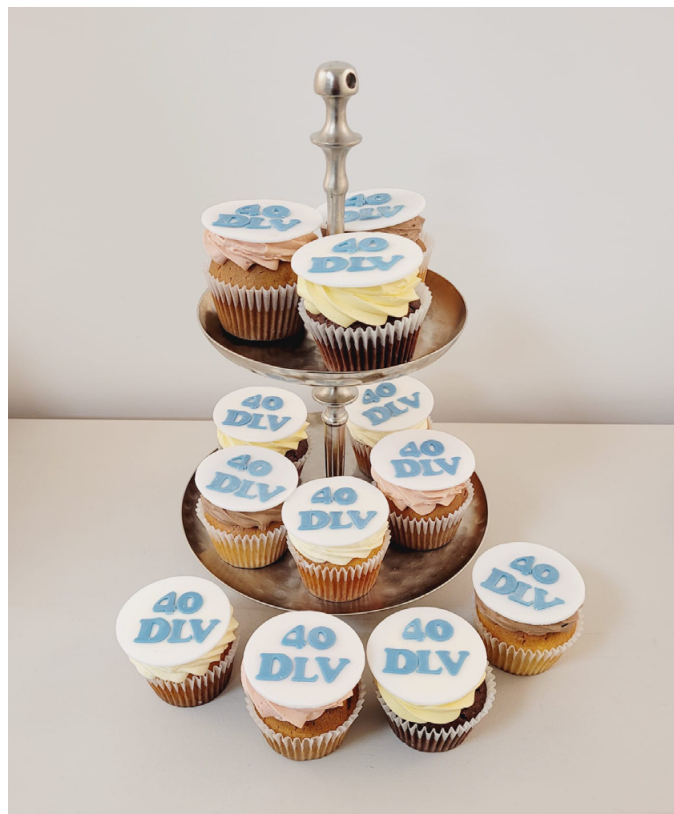
Etwas Süsses zum Jubiläum an der Delegiertenversammlung

Natürlich gehört Kuchen zu einem Geburtstag: An der Delegiertenversammlung kamen alle Anwesenden in den Genuss von DLV-Jubiläums-Cupcakes.